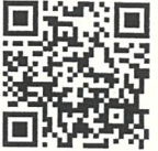
QR-Code เพื่อจองห้องพัก

โทรศัพท์: ๐๒-๔๒๒-๙๒๒๒ E-mail : rsvn@royalriverhotel.com