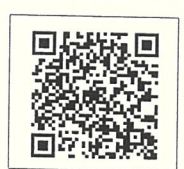
QR-Code เว็บไซต์ QR-Code เพื่อสอบถามข้อมูล