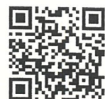
QR-Code เพื่อจองห้องพัก

โทรศัพท์: ๐๒-๔๒๒-๙๒๒๒ E-mail : rsvn@royalriverhotel.com