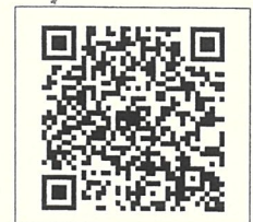
QR-Code เว็บไซต์ QR-Code เพื่อสอบถามข้อมูล