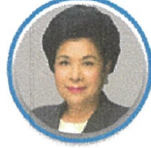
รศ.พรings สอณกiewicz

แพทย์ผู้เชี่ยวชาญด้าน Anti-Aging โรงพยาบาลพญาไท 2